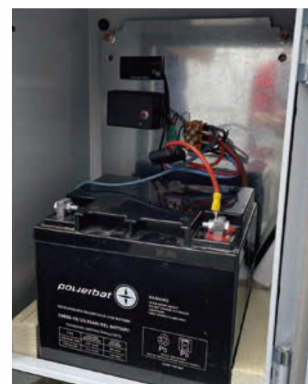
照明用パワーユニット