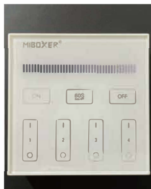
照明用コントローラー